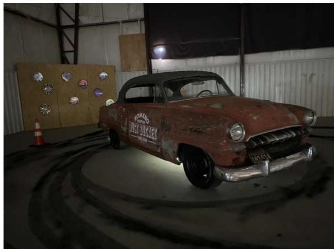
La obra de Camilo Romano.

La obra, además, incorpora la realidad aumentada y a través de distintas herramientas se ve a Coetzy en diferentes etapas.