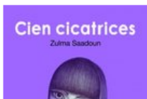
"Cien cicatrices", libro de Zulma Saadoun