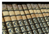
Los libros más vendidos de la semana