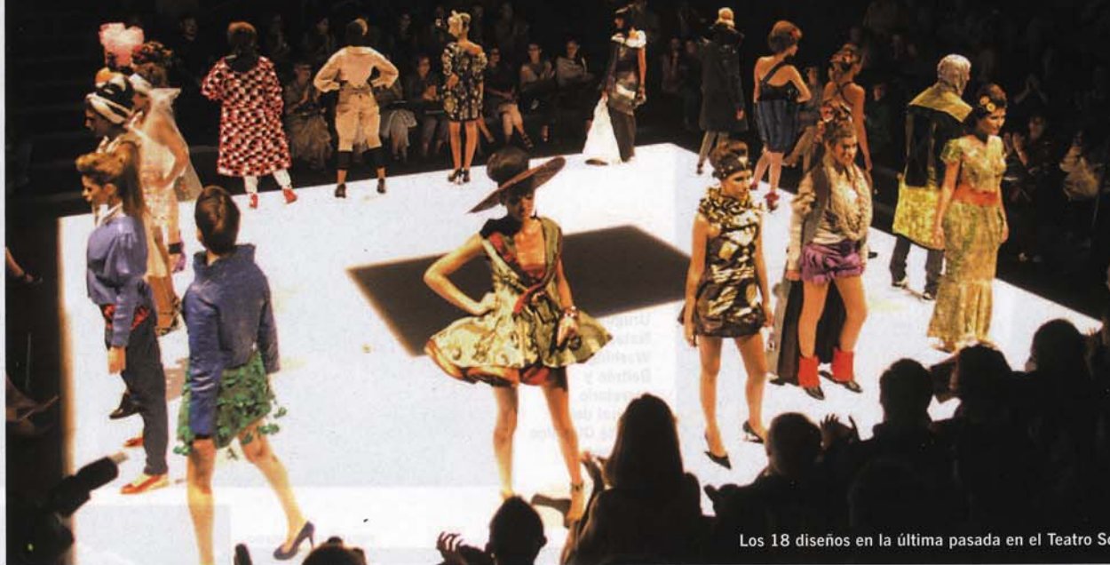
Los 18 diseños en la última pasada en el Teatro S