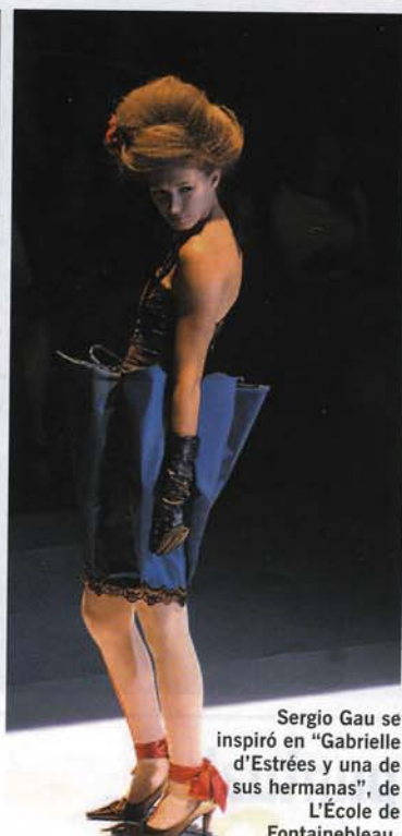
Sergio Gau se inspiró en "Gabrielle d'Estrées y una de sus hermanas", de L'École de Fontainebleau.