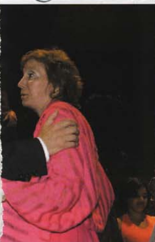
Embajador de Francia Jean-Claude Moyret y ministra de Educación y Cultura María Simon.