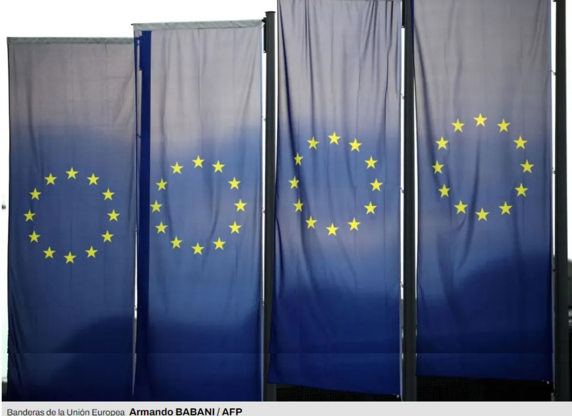
Banderas de la Unión Europea.