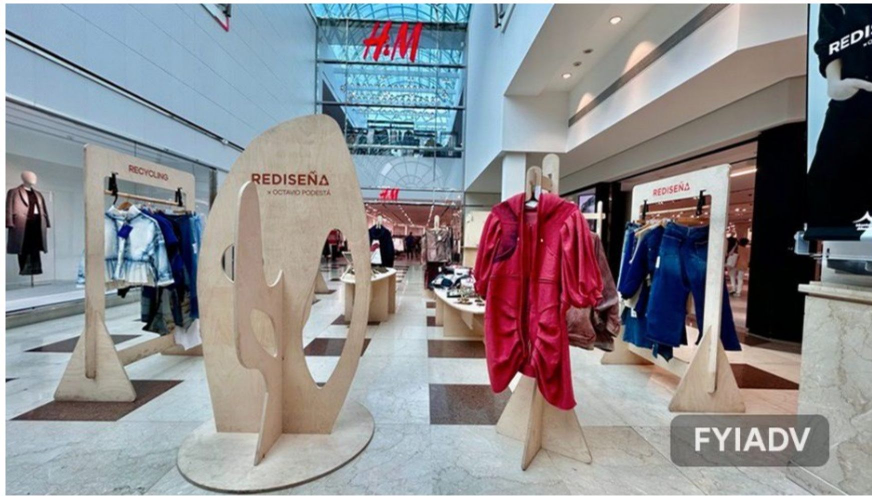
Pop-up de rediseña en el nivel 2 de Montevideo Shopping.