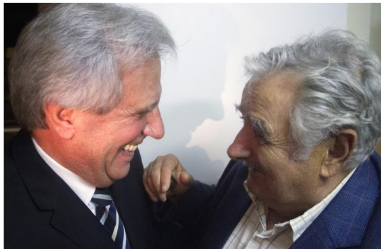
El presidente electo, Tabaré Vázquez (75 años), ríe junto al mandatario saliente, José Mujica (80 años).

Archivado en: Tabaré Vázquez, José Mujica, Jubilación, Uruguay, Relaciones laborales, Sudamérica, Latinoamérica, América, Trabajo