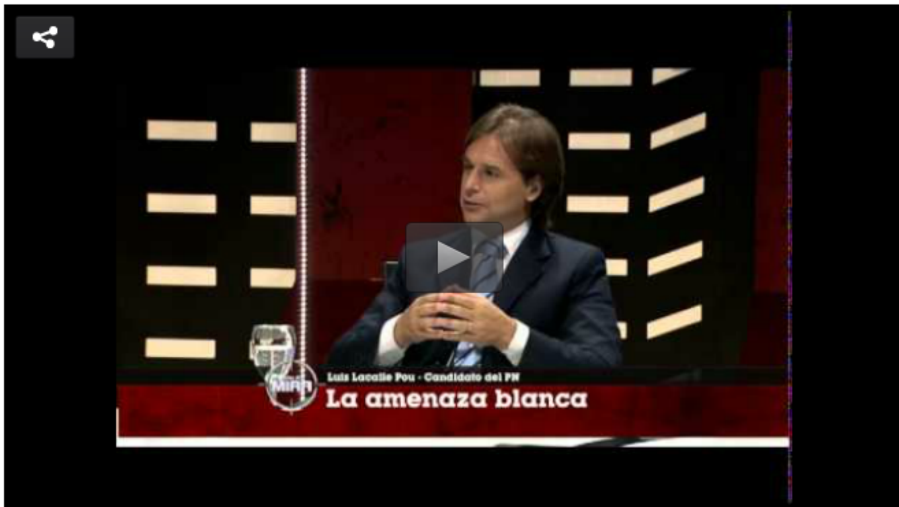
Entrevista al candidato blanco, Luis Lacalle Pou (En la Mira)

Durante la charla, confesó que trató a Lacalle Pou con una fiera que no había aplicado con ningún otro entrevistado y dijo que entrevistar a un político en campaña es el peor momento posible.