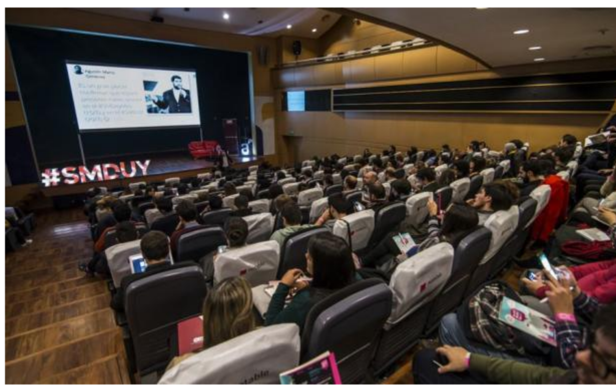
Profesionales y estudiantes asisten año a año al evento que auspicia El País.