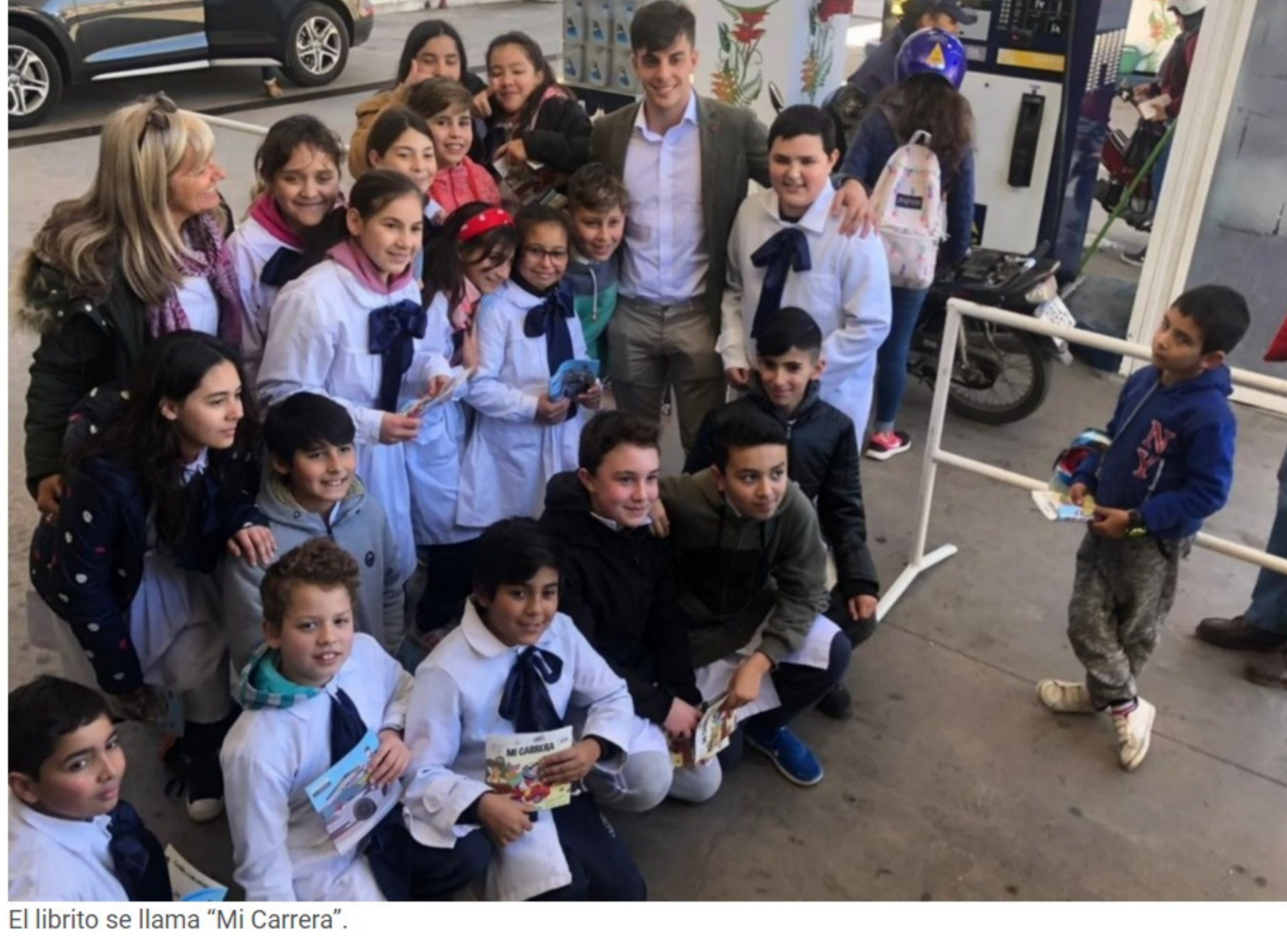
El librito se llama "Mi Carrera".