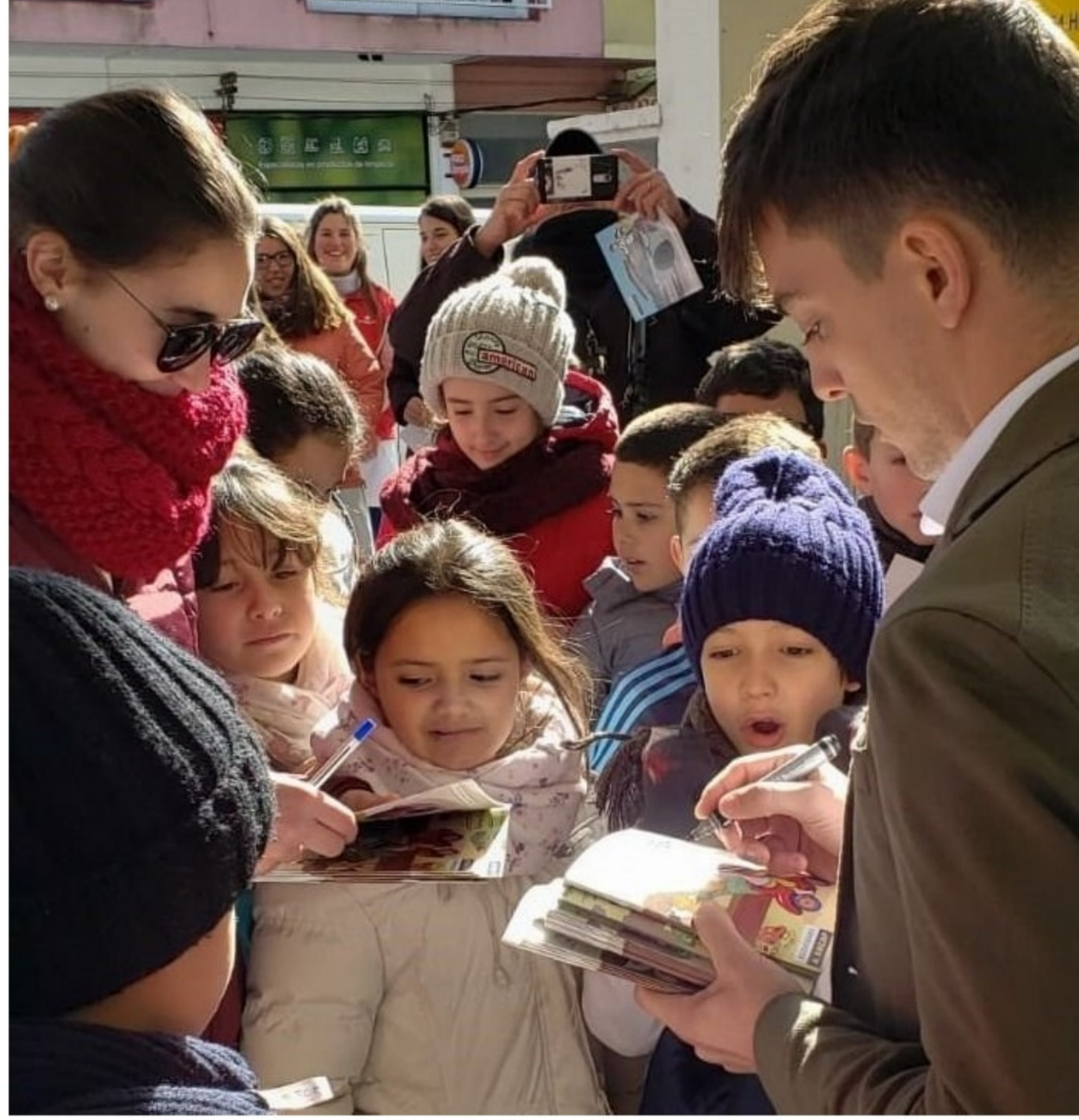
El libro tiene un total de 16 carillas y está dirigido a niños de entre 5 y 11 años.

La propuesta de Ancap, que se realiza todos los años, busca contar una historia o plantear algún juego didáctico, ya sea sobre normas de tránsito, seguridad vial o medio ambiente. Este año el objetivo era contar la historia de vida del piloto uruguayo Santiago Urrutia, con la intención de inspirar a los niños a cumplir sus sueños.