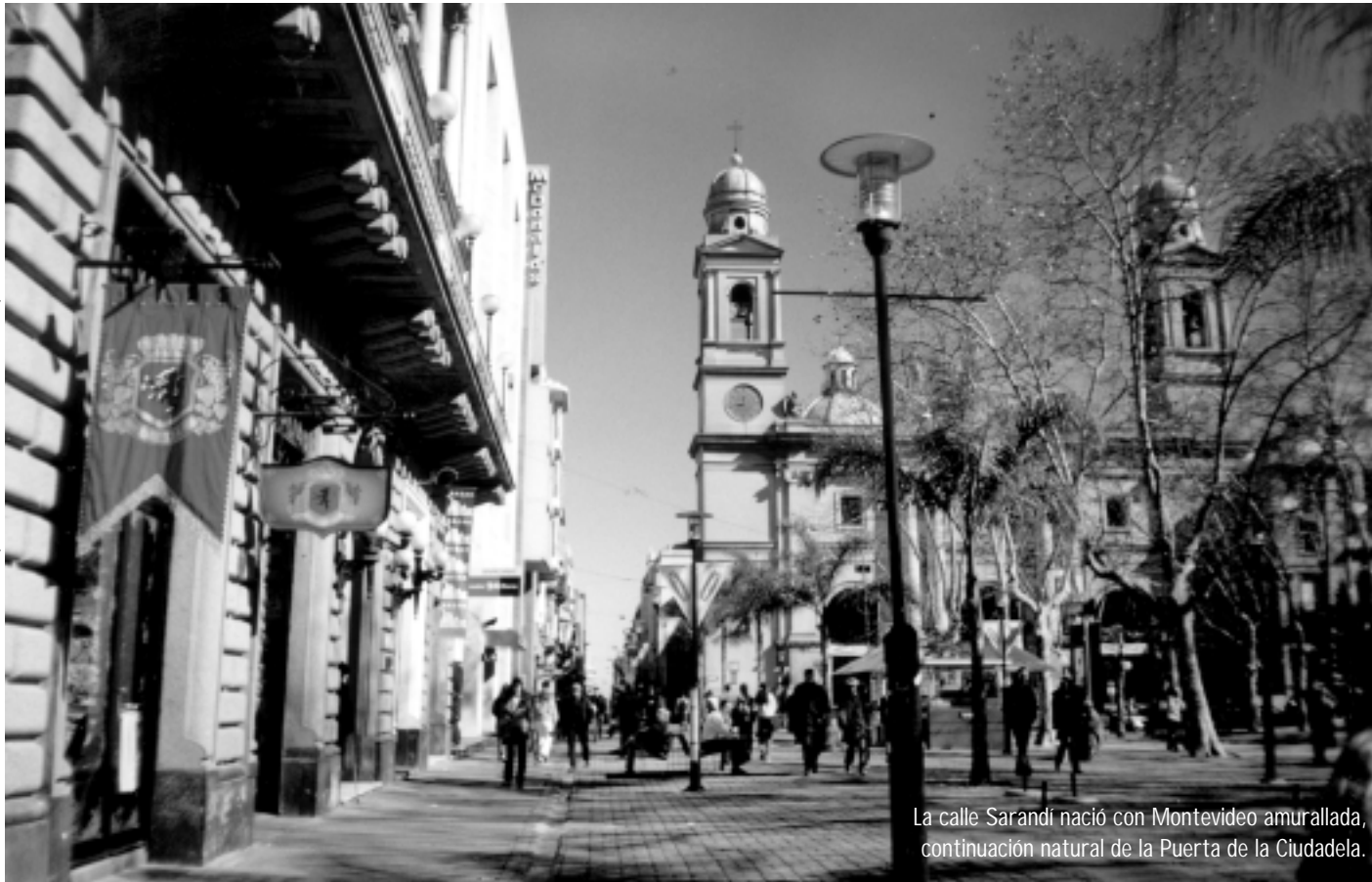
La calle Sarandí nació con Montevideo amurallada, continuación natural de la Puerta de la Ciudadela.

CADA VEZ HAY MÁS QUEJAS DE LOS VECINOS PERO SE SIGUEN HABILITANDO NUEVOS LOCALES