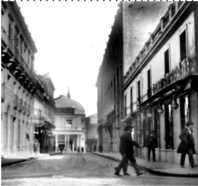
Bacacay, antigua calle de Ciudad Vieja casi 300 años después.