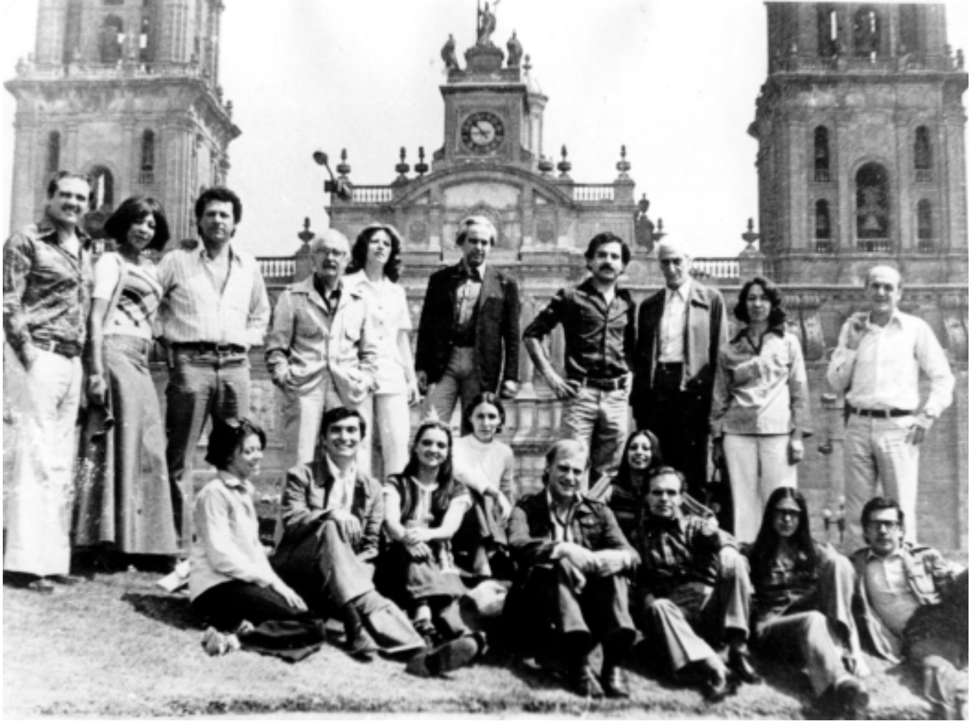
El elenco en México DF.

bre de 1981, en la Universidad Autónoma de México, ya que era el cumpleaños de Líber Seregni. Antes de la función actuaron Alfredo Zitarrosa y Camerata Punta del Este y, al final de la función, varios militares uruguayos que estaban exiliados entregaron al elenco la bandera de Artigas, luego enviada a Seregni.