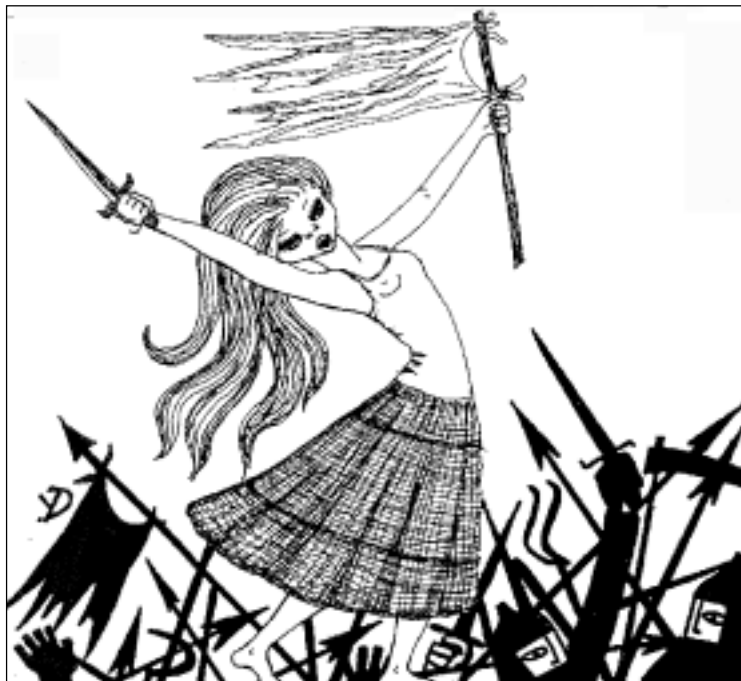
Grabado de Yenia Dumnova

Fue el 6 de mayo de 1976 cuando se decretó la disolución de la Institución Teatral El Galpón. “El Vasco”, como lo llamaba la prensa argentina y murmuraba el pueblo uruguayo refiriéndose a Bordaberry, junto con los