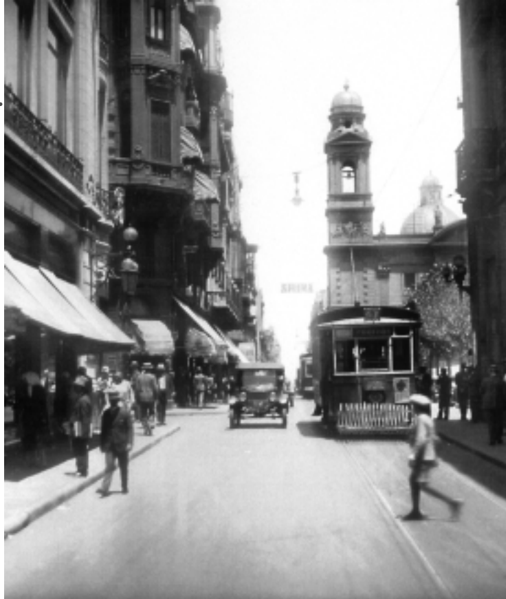
La Iglesia de la Matriz es la primera iglesia construida en Montevideo y fue consagrada el 21 de octubre de 1804. Es el único edificio de nuestra ciudad que se mantiene en pie desde la Colonia y cumple la función para la que fue creado originalmente.

“Ahora tenemos pensado poner baños en las calles porque la capacidad de la mayoría de los bares es reducida en relación a la cantidad de personas que concurren”, concluyó Piroto.