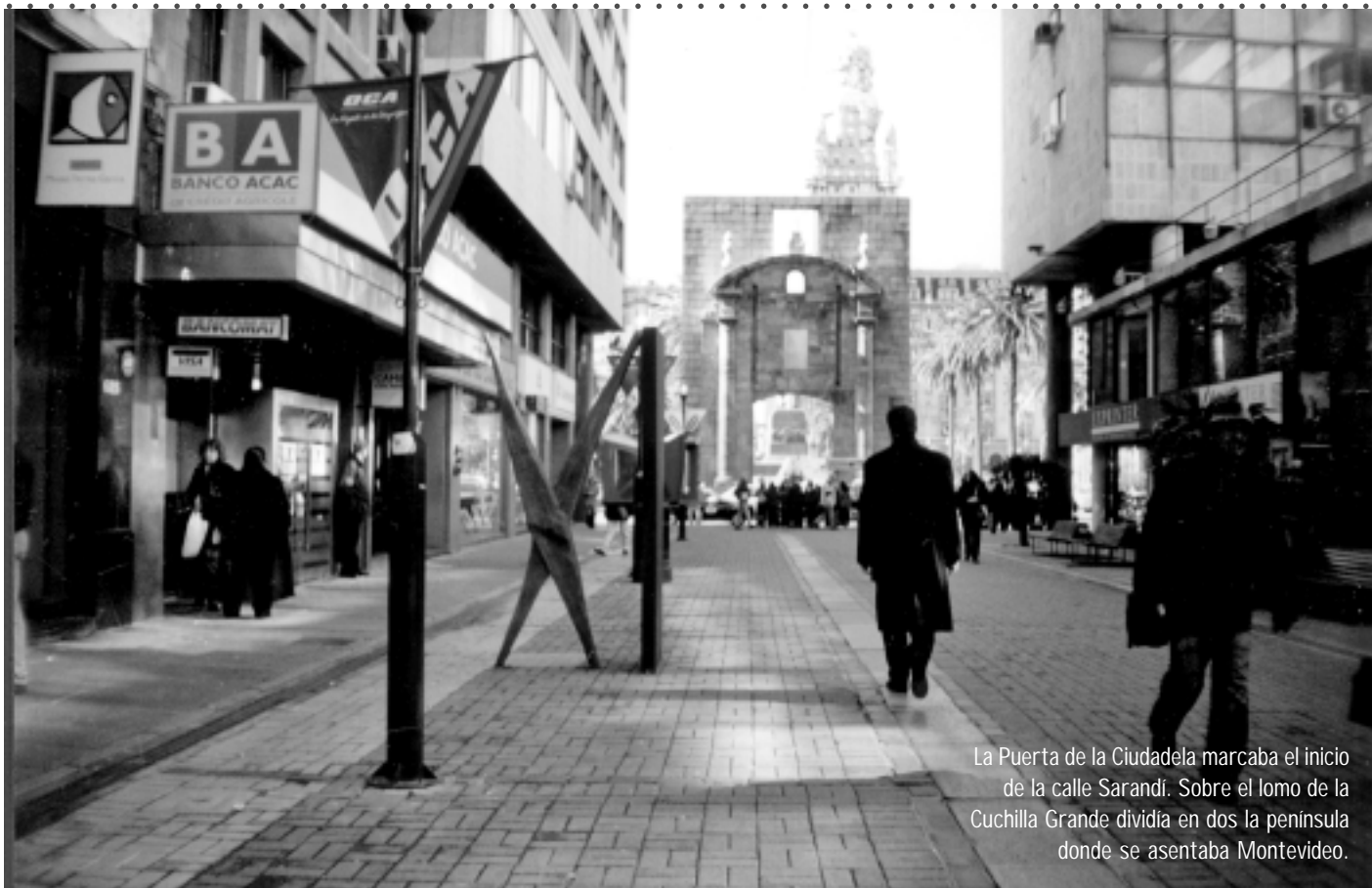
La Puerta de la Ciudadela marcaba el inicio de la calle Sarandí. Sobre el lomo de la Cuchilla Grande dividía en dos la península donde se asentaba Montevideo.