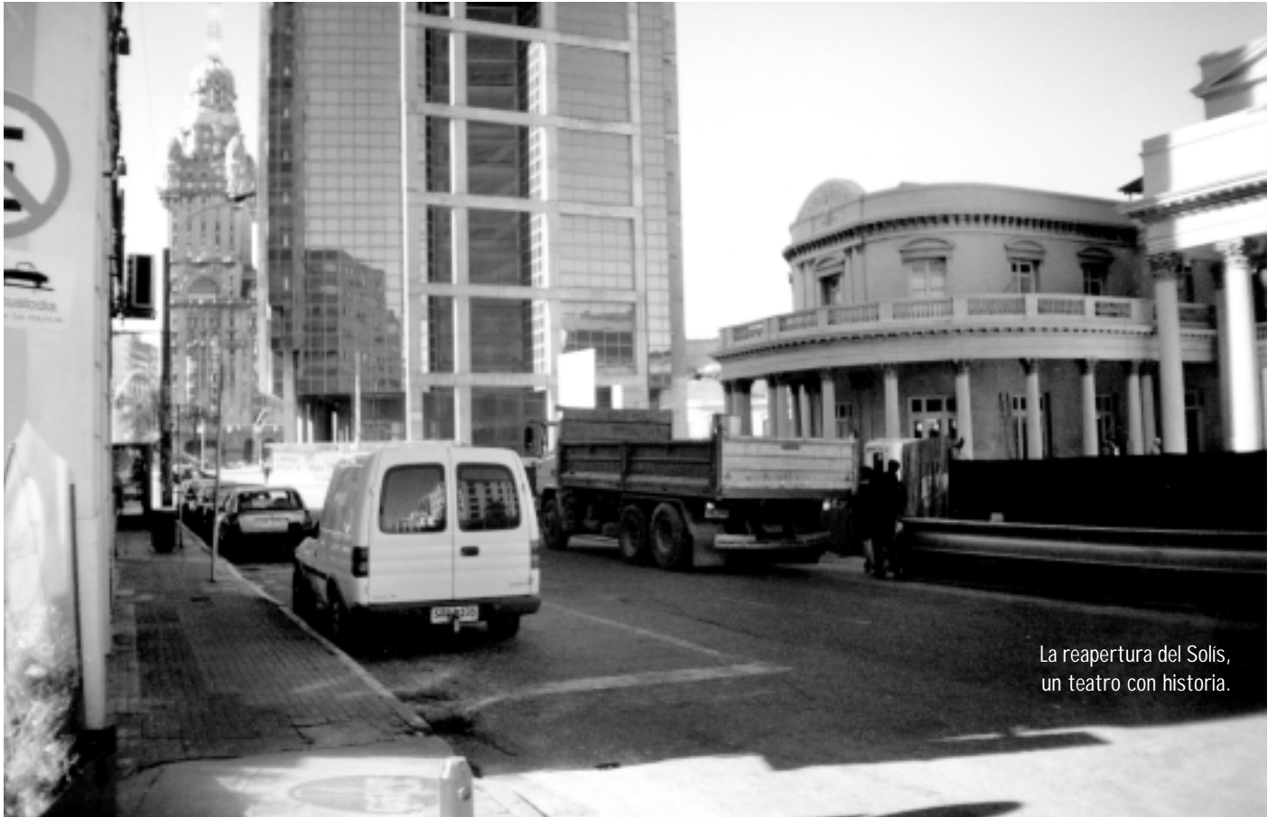
La reapertura del Solís, un teatro con historia.

da las partituras y nos dedica el bolero “A la distancia”. Nos cuenta que lo que más le pide el público del lugar son vales tradicionales y temas de Luis Miguel.