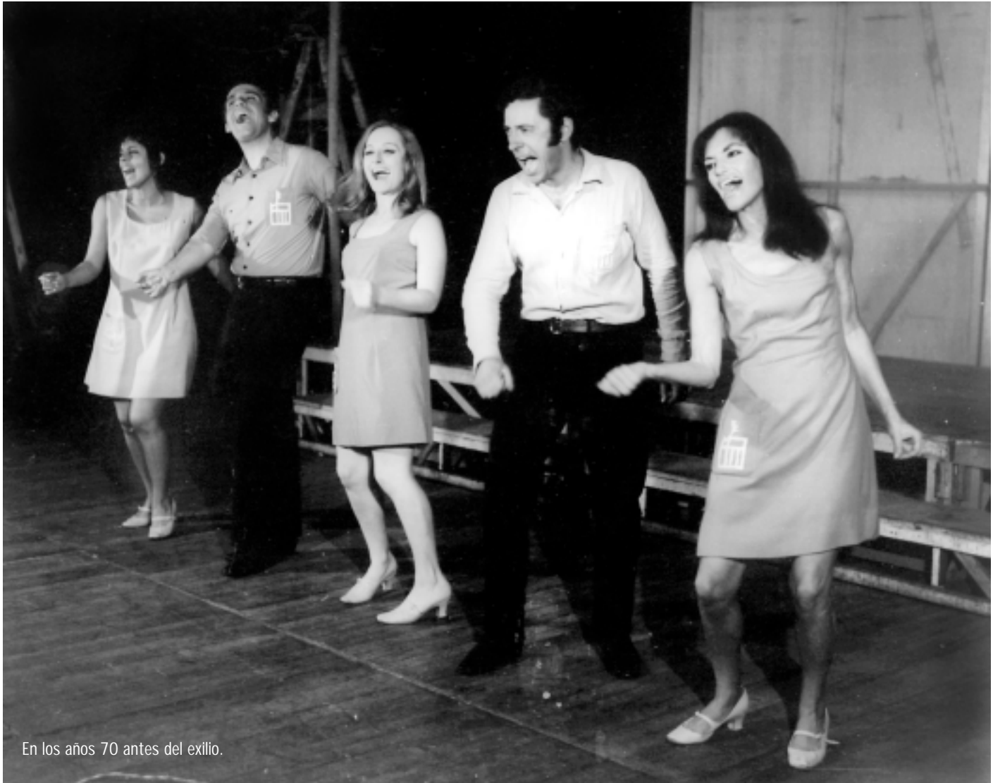
En los años 70 antes del exilio.